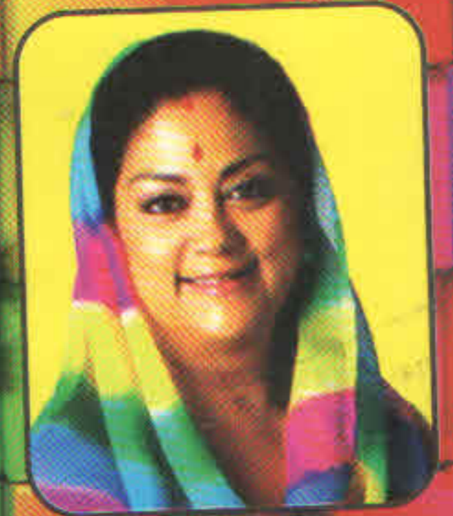
श्रीमती वसुंधारा राजे मुख्यमंत्री राजस्थान सरकार