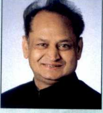
श्री अशोक गहलोट मुख्यमंत्री, राजस्थान