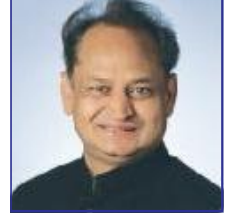
श्री अशोक गहलोट मुख्यमंत्री, राजस्थान

विशिष्ट पंजीकरण योजना - 2019 (केवल दस्तकारों हेतु)