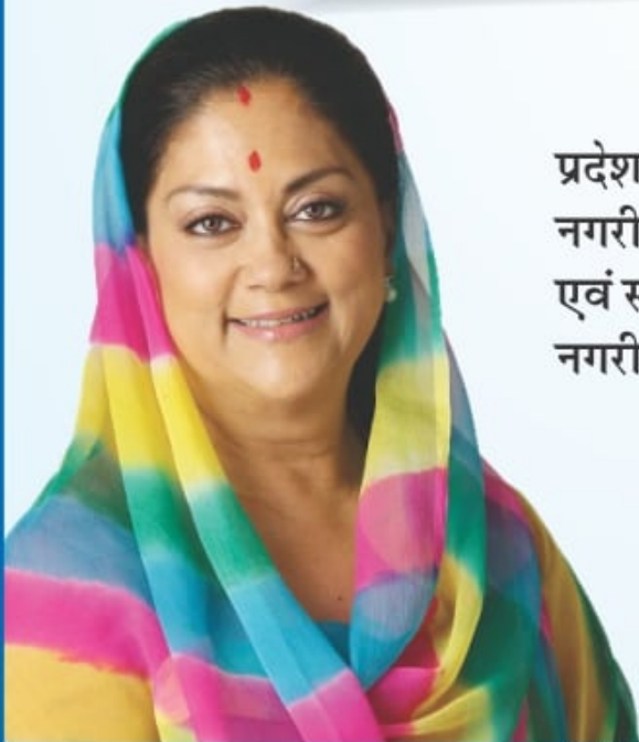
श्रीमती वसुन्धरा राजे माननीय मुख्यमंत्री, राजस्थान सरकार

प्रदेश के विकास प्राधिकरणों, नगर विकास न्यासों व नगरीय निकाय से जुड़े आमजन के दिन-प्रतिदिन के कार्यों एवं समस्याओं के त्वरित निस्तारण के लिए प्रदेश के समस्त नगरीय क्षेत्रों में शिविरों का आयोजन किया जायेगा।