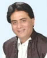
श्री श्रीचंद कृपलानी कायदेत सभे सकल कसत, जलदेत किरत एत जलदेत किरत, सलदेतल सलदेत