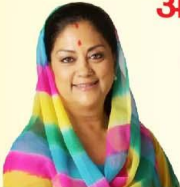
श्रीमती वसुन्धरा राजे मन्त्री एवं, अन्नपूर्णा योजना विभाग का जनसंपर्क अधिकारी