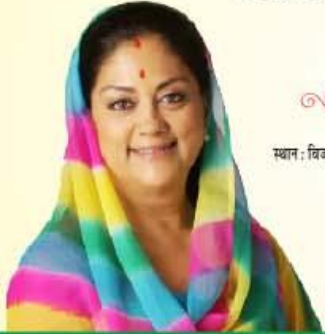
श्रीमती वसुन्धरा राजे मन्त्री एवं, अन्नपूर्णा योजना विभाग का जनसंपर्क अधिकारी

अधिक जानकारी के लिए सम्पर्क करें sfg.urban.rajasthan.gov.in अपने शहर को स्वच्छ रखने के लिए स्वच्छता ऐप